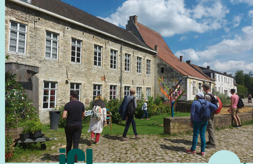
Sorties de l'été d'ESTS

PARCE QU' ICI , NOUS NE NOUS ARRÊTONS JAMAIS DE RÊVER ET D'AGIR POUR DEMAIN