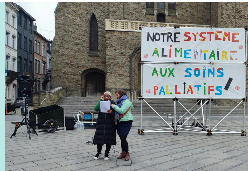
Mobilisation de l'atelier 'Ça Chauffe'

La recherche de ce nouveau nom fut une aventure passionnante. Nous avons reçu de nombreuses propositions et tenions à remercier chaleureusement tous les lecteurs, lectrices, bénévoles, collègues... qui nous ont envoyé des idées et des suggestions souvent très intéressantes. Nous avons longuement scruté des listes et des listes de mots cherchant LE nom qui allait sonner comme une évidence et "ICI" a résonné !