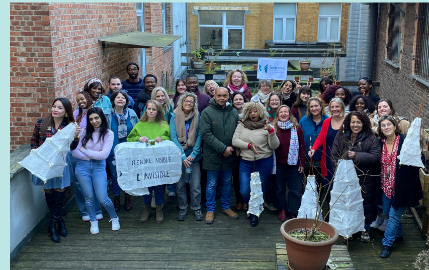
ESTS en février 2025

Ici , chaque rencontre fait la différence, chaque action compte. C'est ici que nous accueillons, écoutons, accompagnons et parfois transformons les réalités des personnes en situation de précarité.